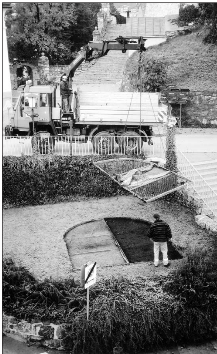
Einwintern des Wappengartls, seit kurzem behilft man sich hier mit einem transportablen Containersystem, eine Erleichterung für Pflanzung und Abräumung.

muss man sich auch nach restlicher Verfügbarkeit der für das jeweilige Jahr vorgesehenen Geldmittel richten, bei Unaufschiebbarkeit hilft die städtische Finanzverwaltung durch geschickte Umschichtung nahezu immer aus. Eine kleine Bildauswahl soll die Vielfalt der Aufgaben im Bereich Gemeindevermögen verdeutlichen.