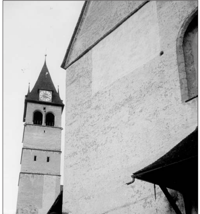
Deutlich sichtbare Probeflächen am großen Turm und an der Nordwestseite der Pfarrkirche

Wie bekannt, ist eine Restaurierung für die nächsten Jahre geplant und es gibt seit zwei Jahren Vorarbeiten dazu. Diese haben gezeigt, dass das überlieferte Erscheinungsbild der Kirche offenkundig vom Alter und somit von den originalen 300 bis 500 Jahre alten Materialien herrührt und dass diese alten Verputze noch überwiegend in einem sehr guten Zustand sind. Die historischen und technischen Ergebnisse der Untersuchungen und die Optionen des künftigen Restaurierungskonzeptes sollen nun in einem Informationsabend der Bevölkerung durch die Projektbeteiligten und das Bundesdenkmalamt vorgestellt werden. Die Präsentation findet statt am Donnerstag, 27. November 2003, um 19.30 Uhr im Kolpingsaal . Dipl.-Ing. Walter Hauser von Landeskonservatorat Tirol des Bundesdenkmalamtes, erstklassiger Fachmann und Betreuer dieses Projektes wird durch den Abend führen. Die Pfarre St. Andreas würde sich über zahlreichen Besuch freuen.