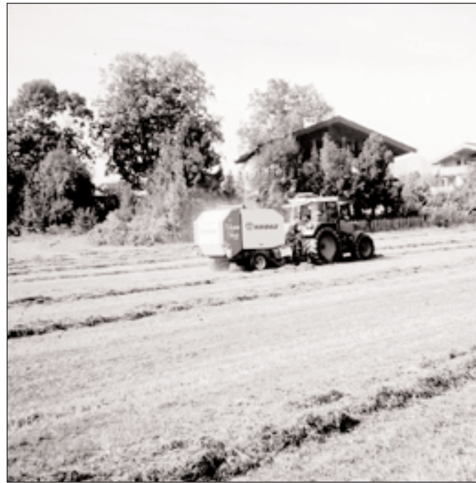
Dieses Foto von der Heumahd im vergangenen Sommer wird bald Geschichte sein, das Jodlfeld wird Bauland.

Länger befasste man sich mit dem Problem Taxi-standplatz, dieses ist bekanntlich ungelöst. Ein Vorschlag des Ausschusses auf Einrichtung eines Nachtstandplatzes im Schulhof