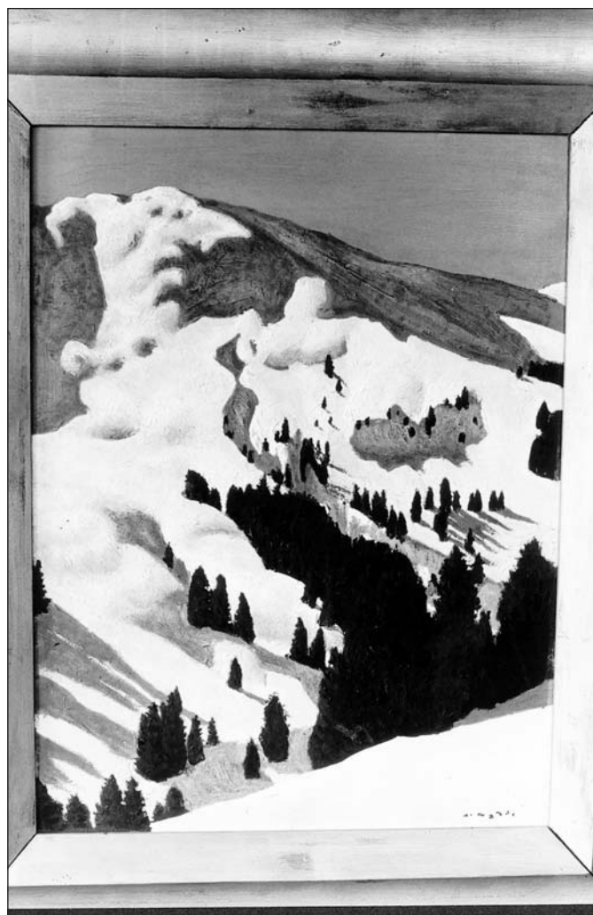
Alfons Walde „Steinbergkogel“, Tempera auf Karton um 1926

dem Motiv „Schnee“, der in Wechselspiel von Licht und Schatten Plastizität und Eigenleben erhält. Der Fotograf Angerer arbeitet mit einem anderen Medium als der Maler Walde – in ihrer Auffassung der Kitzbüheler Schneelandschaft sind die beiden verwandt. Mit seiner Auswahl an den Werken Angerers und Waldes lädt das Museum Kitzbühel zur Auseinandersetzung mit den beiden Künstlern ein.