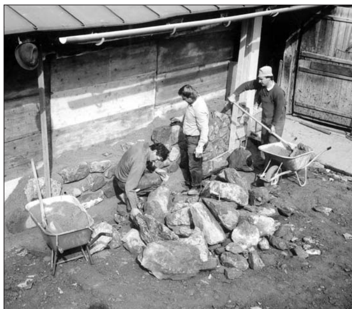
Laufender Verbesserungsbedarf herrscht an den städtischen Almhütten am Hahnenkamm