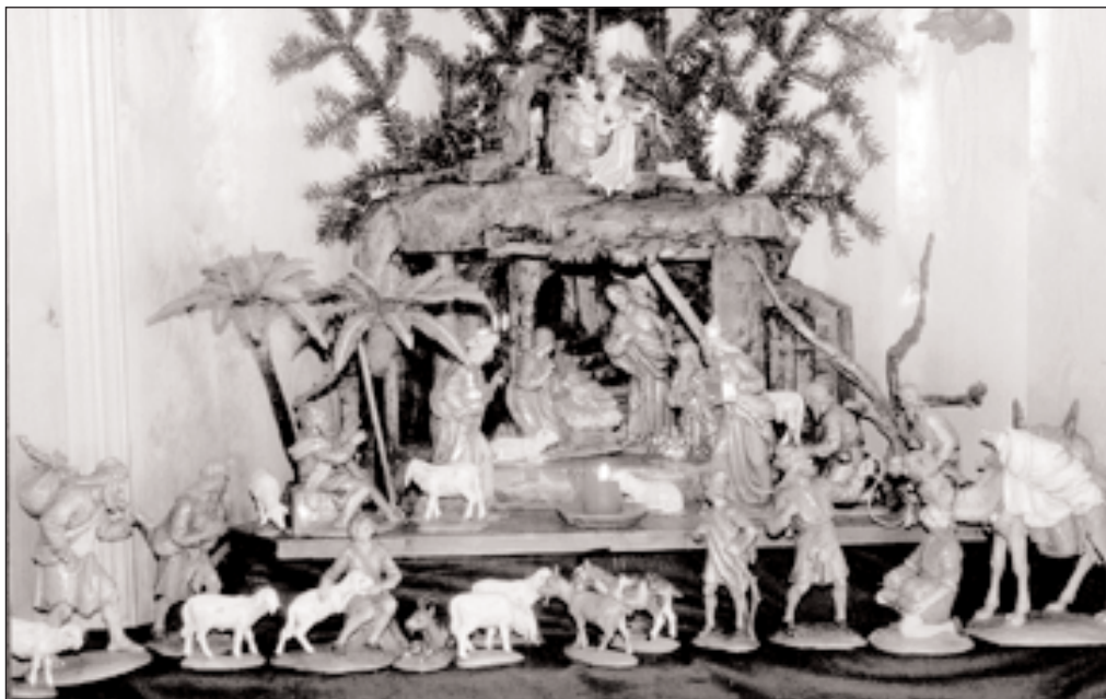
Kirchmaier-Krippe 1989