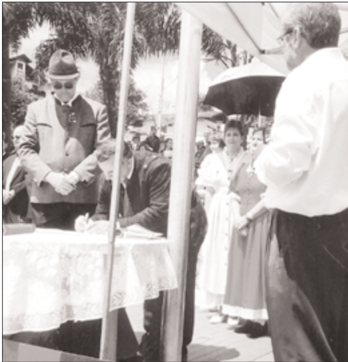
Festakt in Dreizehnlinden: Verschwisterung mit Wildschönau