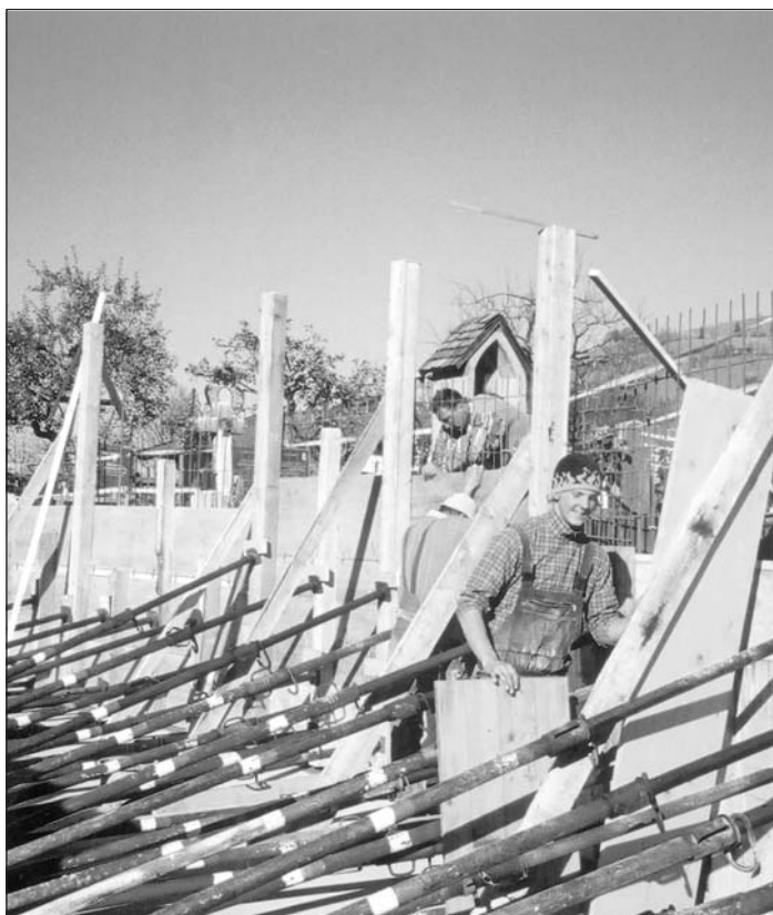
Ein kompliziertes Unterfangen: Die wegen des Hangdrucks schadhafte bogenförmige Friedhofsmauer am Leberbergweg wird erneuert.